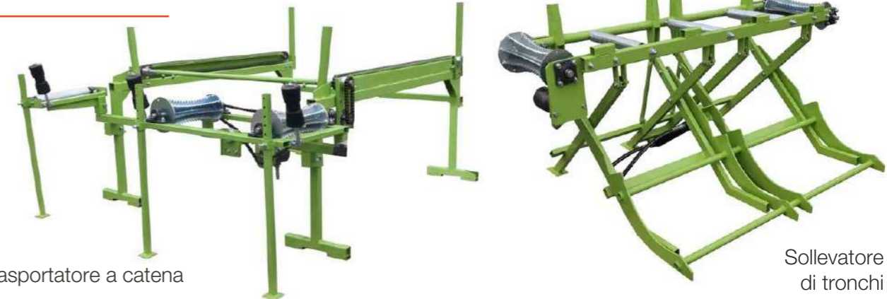
Tavolo Trasportatore a catena